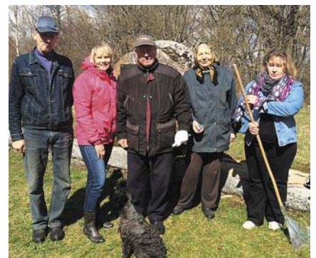
Talcinieki pie bijušās Stacijas.

Lielās talkas finālā – 23. aprīlī, čakli rostījās talcinieki ne tikai oficiāli pieteiktajās talkas vietās – „Kalaņģos”, Piemiņas vietā pie bijušās Stacijas, pie Ražotāju diķa, Augstajos kalnos un pie Velēnas baznīcas; talkotprieks bija pārņēmis arī Balstu un Parka ielas 1 daudzdzīvokļu māju iedzīvotājus, individuāli tika sakoptas ceļa malas uz Grūšļiem. Katrā talkas vietā valdīja darbīgs noskaņojums, skanēja jautras valodas, bija kopīgs cienasts un labi padarīta darba sajūta. Paldies visiem talciniekiem par atsaucību un piedalīšanos!