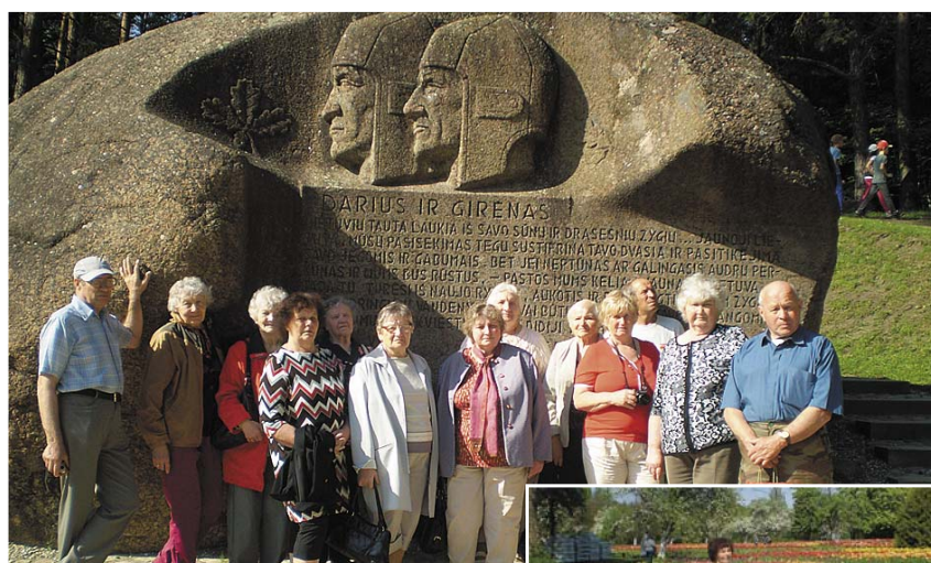
Mūsu rosīgie seniori 12. maijā priecājās par ziedošajām tulpēm Burbišķos, izbaudīja pastaigu starp koku galotnēm, baudīja pavasarīgās ainavas gan Lietuvā, gan Latvijā. Gaišām emocijām piepildīta diena!