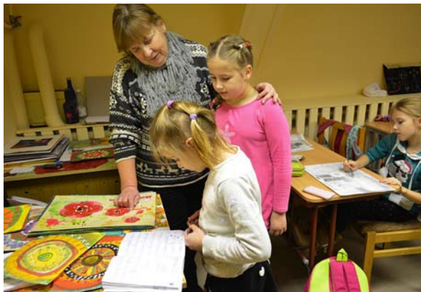
Šogad Mākslas skolas nodarbības notiek meiteņu mājturības kabinetā.