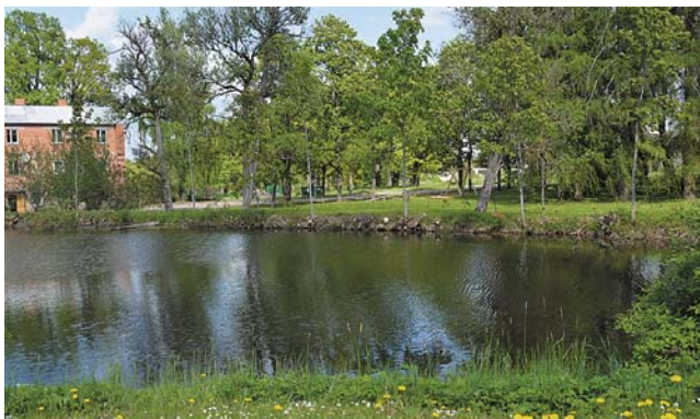
Tāda ainava tagad pie Ražotāju diķa.