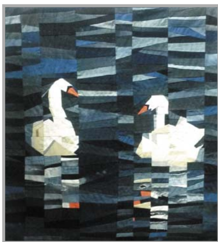
No 23. maija līdz 28. maijam mūsu novadniece Ilze Šulja ar saviem darbiem piedalās izstādē Ontario Kanādā. Tur eksponēts arī šis darbs.