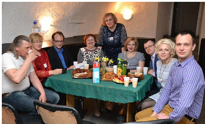
Lizuma amatierteātris „Daiva”

Pateicoties mūsu amatierteātrim „Daiva” man ir tas gods šodien Jūs sveikt šeit. Jo strādājot kultūras namā jau ceturtdaļgadsimtu man nav bijusi iespēja Gulbenes novada amatierteātru dalībniekus redzēt vienkopus Lizumā, kā tas ir šodien.